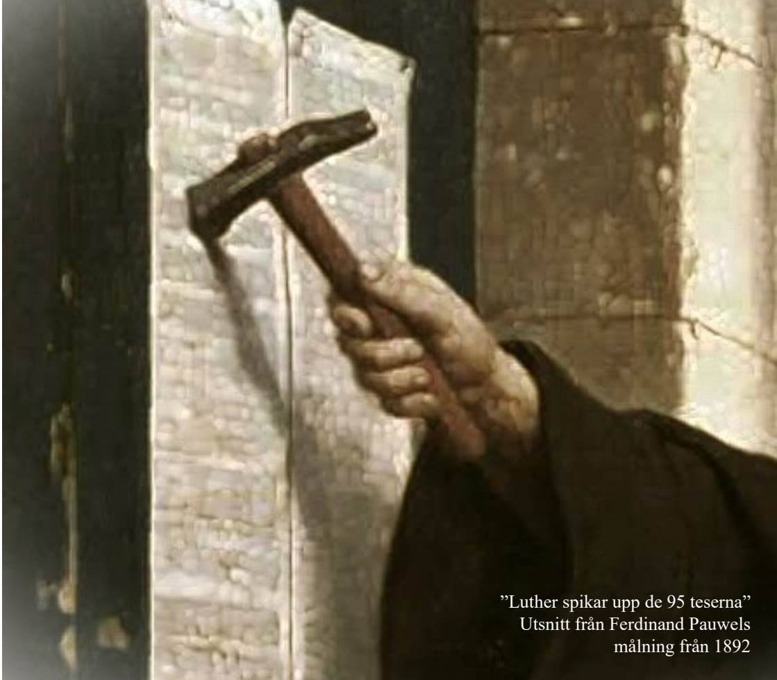
”Luther spikar upp de 95 teserna” Utsnitt från Ferdinand Pauwels målning från 1892

det som verkligen betyder något. Utan mod hade historiens viktigaste skeenden aldrig inträffat. Ett känt exempel är Martin Luthers ord under en mycket svår tid efter påvens bannlysning 1520. Han hade kallats till riksdagen i Worms, för att ges en möjlighet att ta tillbaka sina teser där han bland annat ivrigt hade angripit avlatshandeln. Man kan inte köpa syndernas förlåtelse, menade han. En människa får en rätt ställning inför Gud enbart genom tron. Denna viktiga lära om rättfärdiggörelsen genom tron är en hörnsten i den kristna tron.