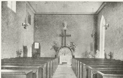
Den nya kyrkans interiör.

En lång vandring från uppropet i februari 1923 har tillryggalagts, man har nått målet — Mälarhöjdens kyrka är invigd. Församlingsarbetet kan börja med kyrkan mitt i samhällets centrum.