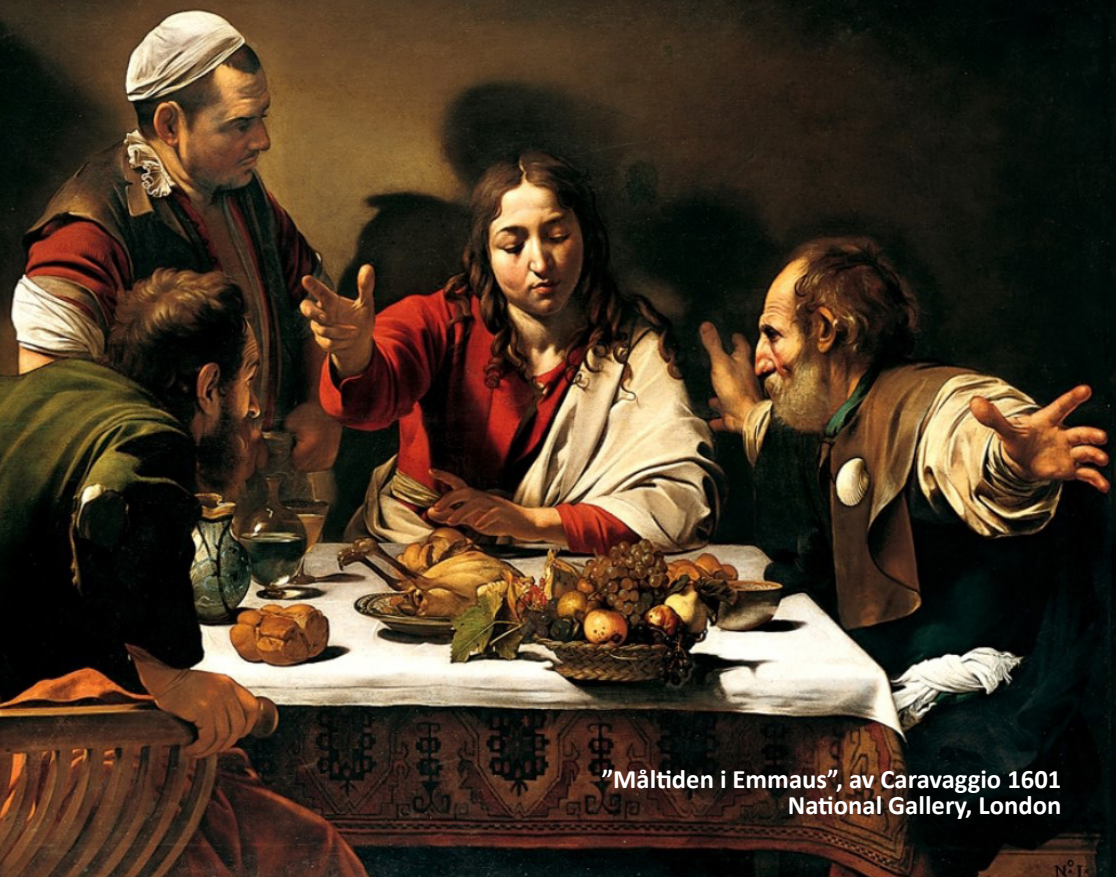
"Måltiden i Emmaus", av Caravaggio 1601 National Gallery, London

Fadern älskar sonen för att han av egen fri vilja väljer att ge sitt liv till lösen för oss alla.