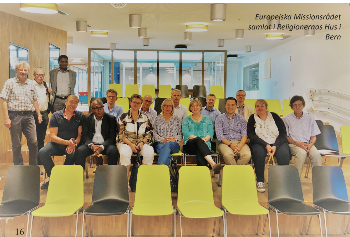
Europeiska Missionsrådet samlat i Religionernas Hus i Bern

amerikanska Brödrmissionen) och Unity Women Board (Kvinnornas särskilda gren i missionsarbetet) samt den schweiziska organisationen Mission21 som stod som värd för konferensen i år. Mission21 är en sammanslagning av den gamla herrnhutiska missionsrörelsen i Schweiz och Baslermissionen och har en budget på ca 140 miljoner kronor per år, att jämföra med vår betydligt blygsammare budget på ca 180 000 kronor per år. Dessa olika missioner verkar över hela jorden och bildar ett imponerande nätverk som ständigt växer i och med att nya regioner nås och nya församlingar bildas.