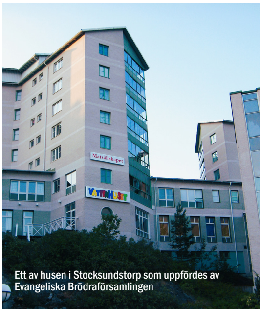
Ett av husen i Stocksundstorp som uppfördes av Evangeliska Brödräfsamlingen