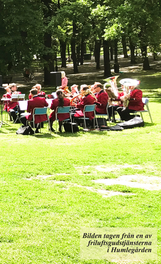
Bilden tagen från en av friluftsgudstjänsterna i Humlegården

Hedvig Eleonora har arrangerat flera välbesökta konserter, som operamaraton och andra musikmaraton m.m. där man samlar in pengar till Ukraina.