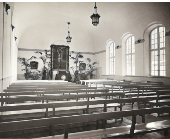
Kyrkan på Sveavägen. Fastighetens exteriör och kyrksal

som första gången kom ut i Sverige 1743 hade i slutet av 1800-talet en upplaga av 32 000 exemplar. Ännu mer häpnadsväckande är att den finska upplagan under samma tid